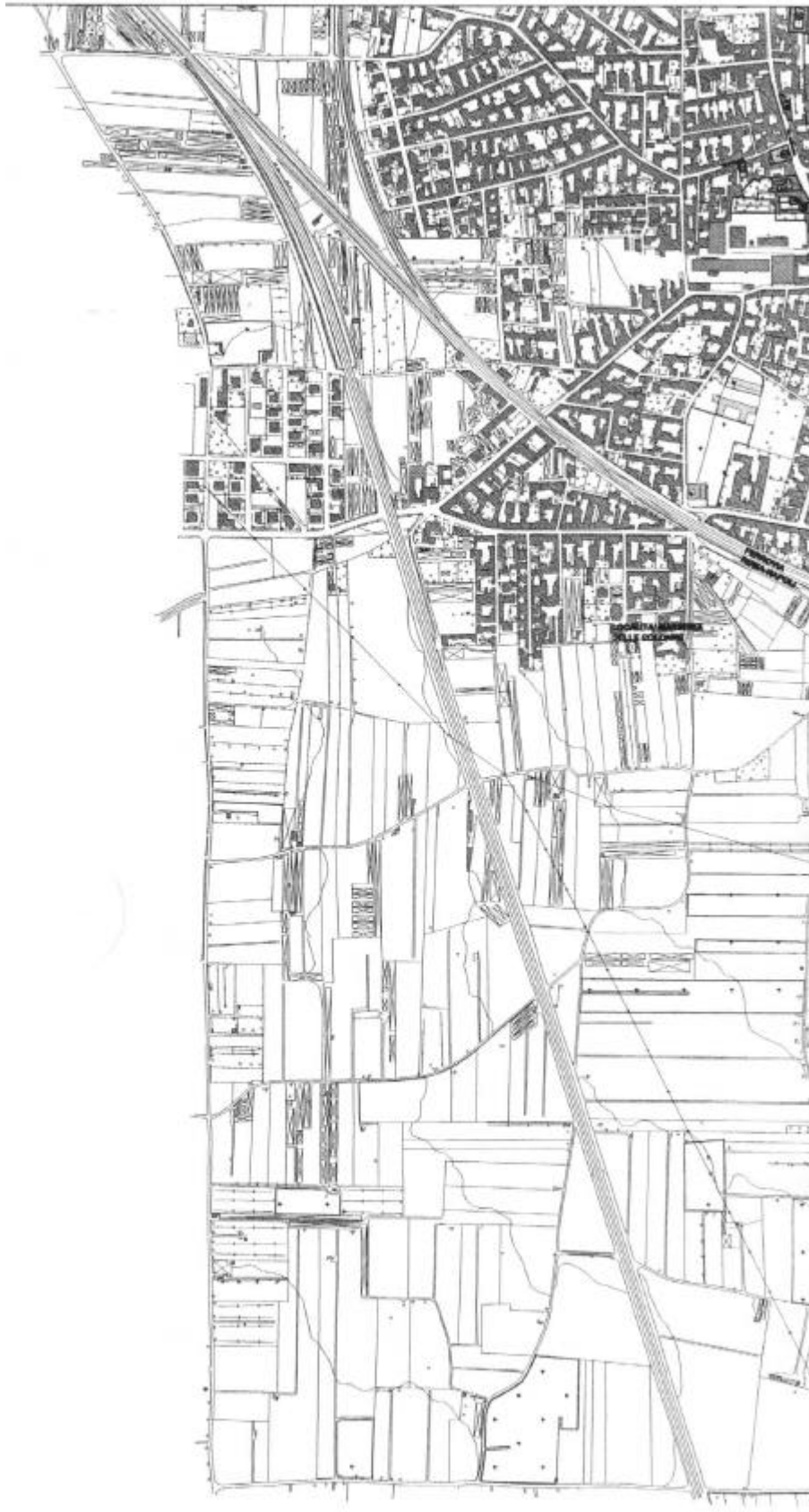
Figura 1c : localizzazione delle unità edilizie di riconosciuto interesse culturale